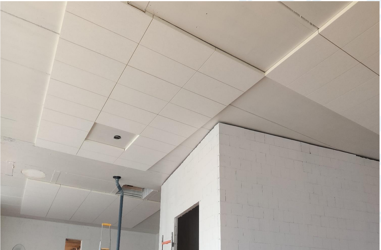
Iv-konehuoneen katon äänenvaimennuslevyasennus