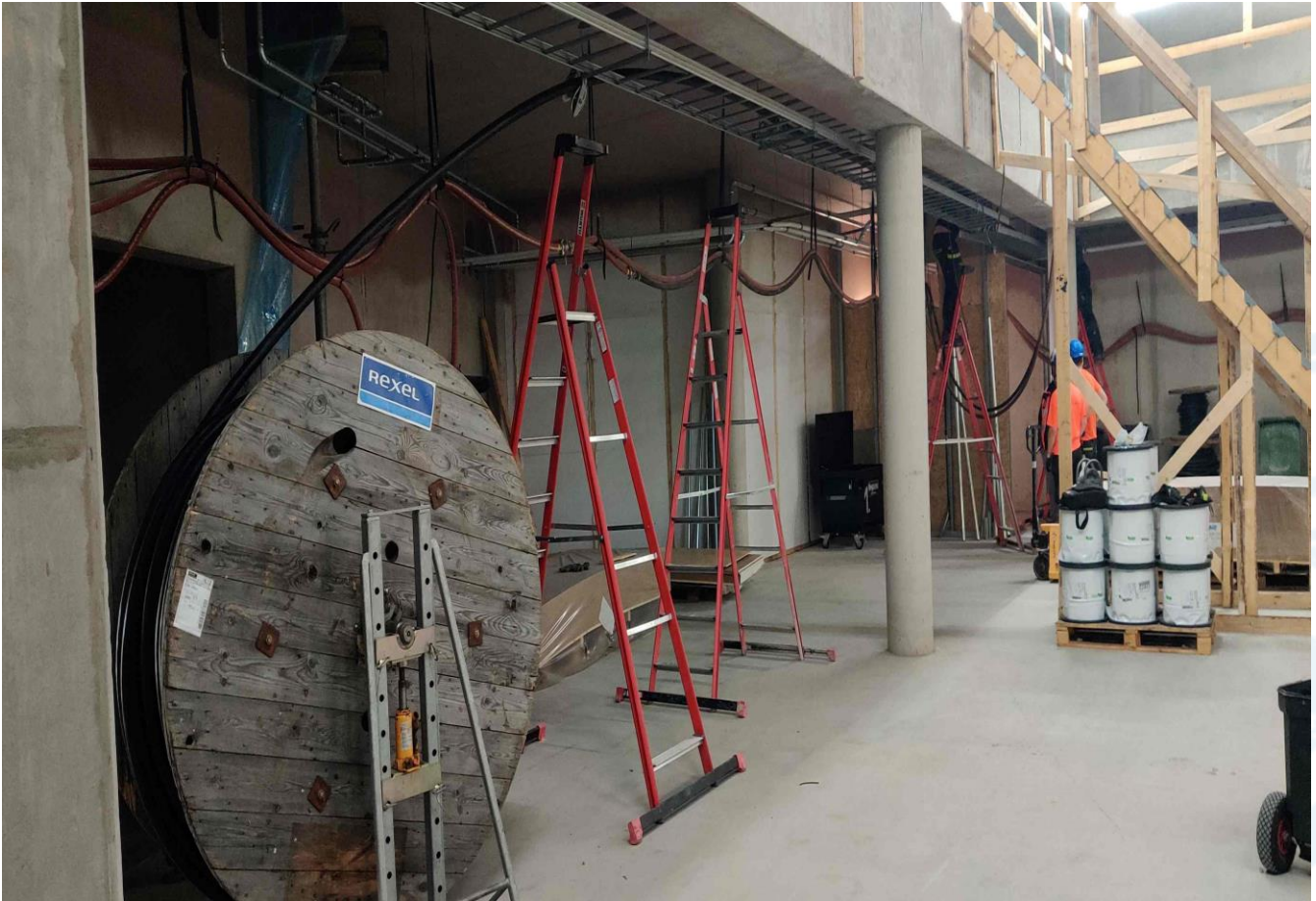
1. kerroksen aula